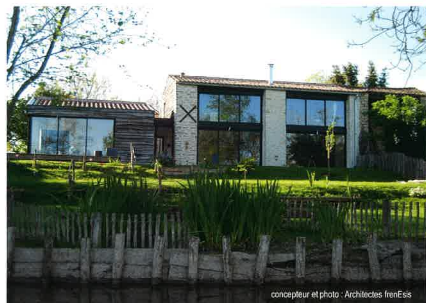
concepteur et photo : Architectes frenEsis

(voir le détail des phases ci-contre et le détail des engagements dans le dossier de candidature)