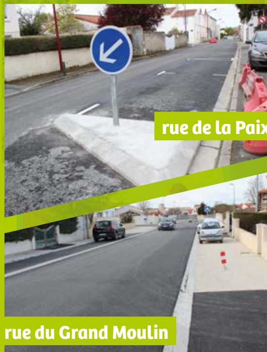
rue de la Paix